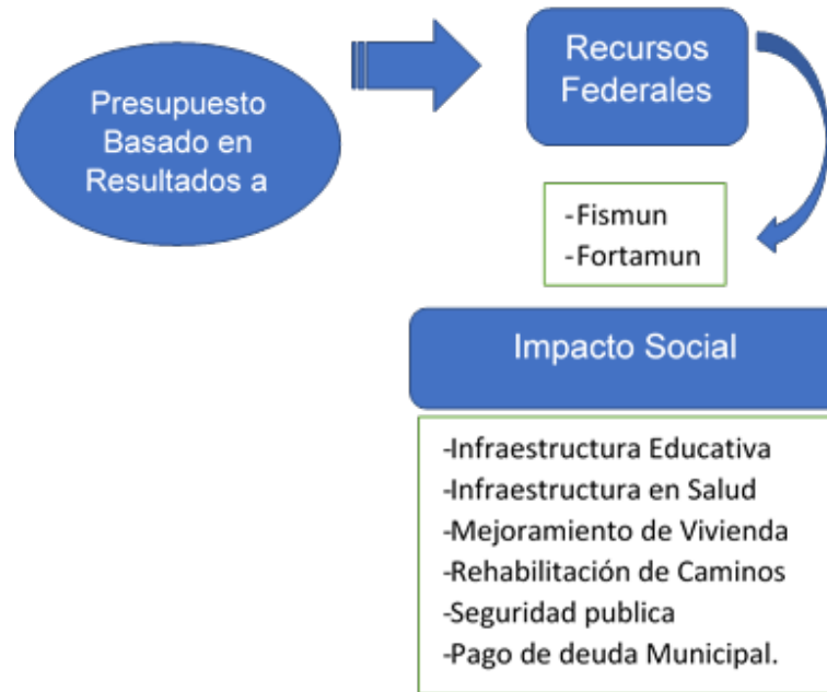
Figura 2. Marco Conceptual