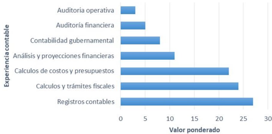
Gráfico 1. Expertise contable